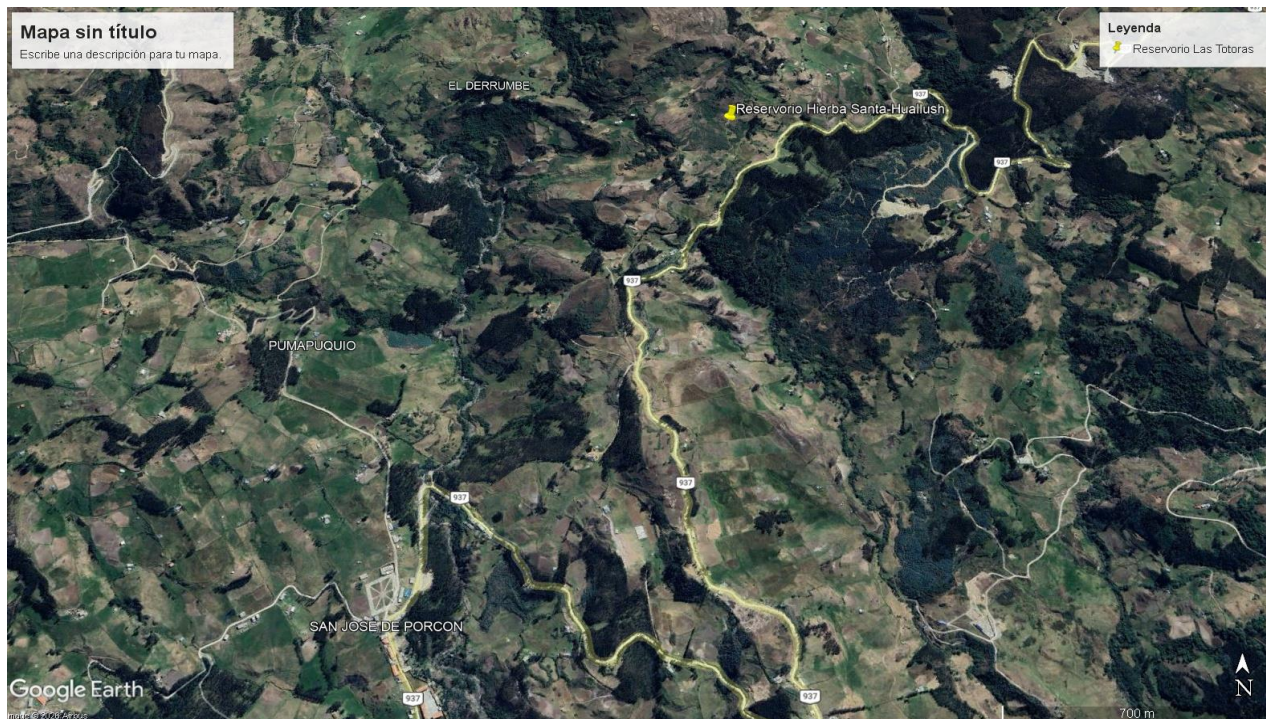
Punto de Muestreo: RESERVORIO HIERBA SANTA HUALLUSH

RESERVORIO HIERBA SANTA HUALLUSH: UTM 17L Oeste 815231 Norte 9112930, 3250.8 msnm